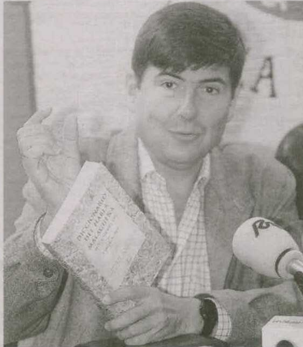
AUTOR. Manuel Pimentel viaja a África en su obra.